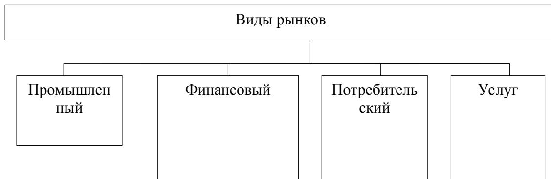
Рис. 1 - Классификация моделей пенсионного обеспечения

Примечание - Составлено автором по данным Росстата.