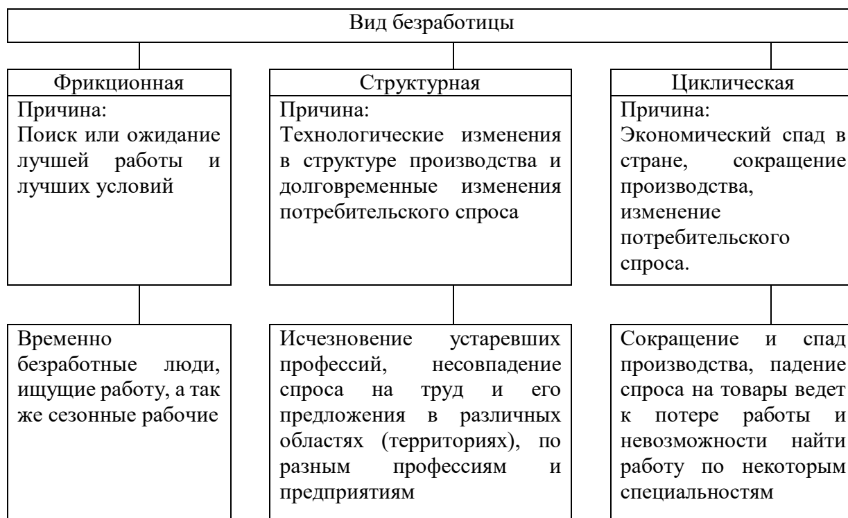
Рис. 1.1 - Виды безработицы

Примечание – Капелюшников Р. И. Общая и регистрируемая безработица: в чем причины разрыва?. - М.: ГУ ВШЭ, 2002. – С. 48.