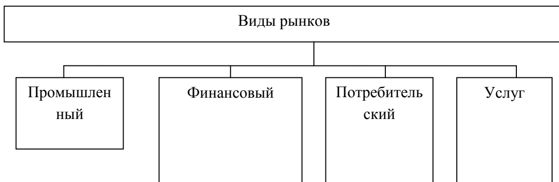
Рис. 1 - Классификация моделей пенсионного обеспечения

Примечание - Составлено автором по данным Росстата.