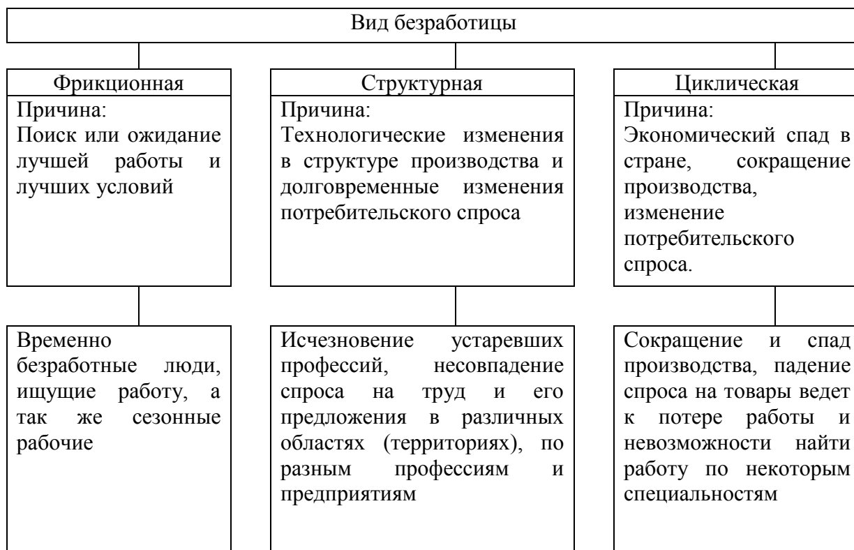
Рис. 1.1 - Виды безработицы

Примечание – Капелюшников Р. И. Общая и регистрируемая безработица: в чем причины разрыва?. - М.: ГУ ВШЭ, 2002. – С. 48.