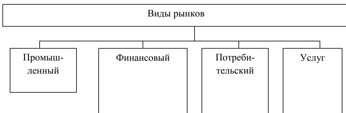
Рис. 1 - Классификация моделей пенсионного обеспечения

Примечание - Составлено автором по данным Росстата.