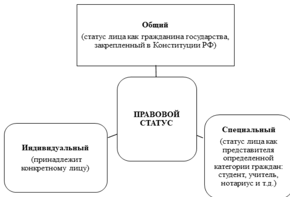
Рис. 1. Виды правового статуса

Правовой статус бывает общим, специальным и индивидуальным (рис. 1).