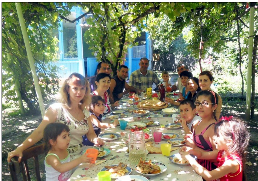
Семейство Данакари. Во дворе родного дома. Поселок Нидж. Июль 2014 г.