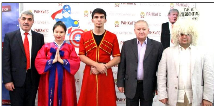
Праздник национальных культур в Волгоградском институте управления РАНХиГС. Март 2017 г.