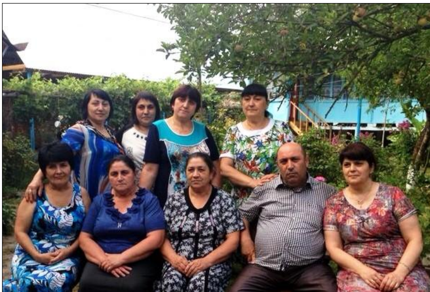
Во дворе родного дома семьи Дингилиши. Поселок Нидж. Азербайджан.