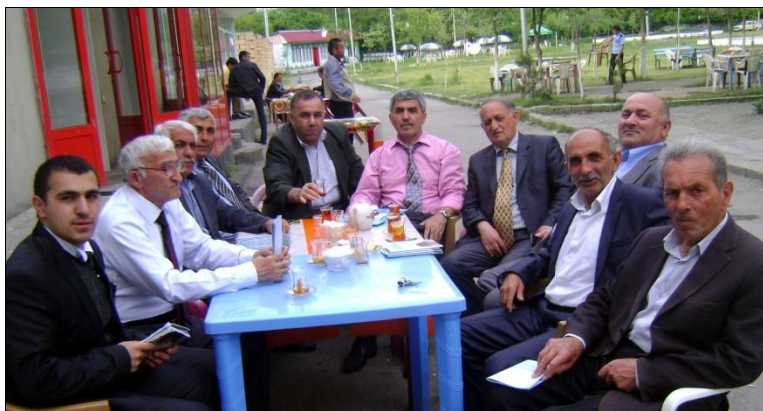
Делегаты международной удинской конференции. Центр поселка Нидж. Апрель 2012 г.