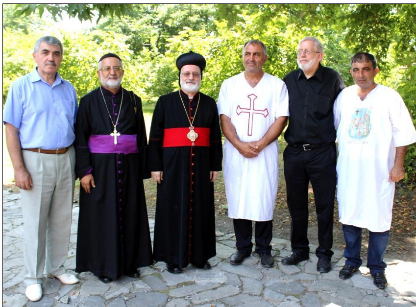
Встреча со священниками Сирийской православной церкви (Турция). Поселок Нидж. Июль 2016 г.