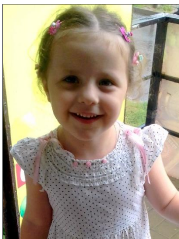
Внучка Элизабет Данакари