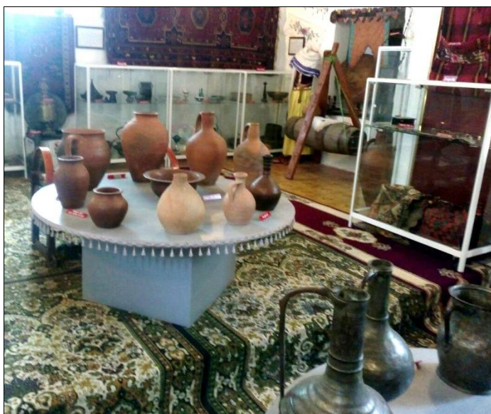
Краеведческий музей. Город Огуз. Азербайджан