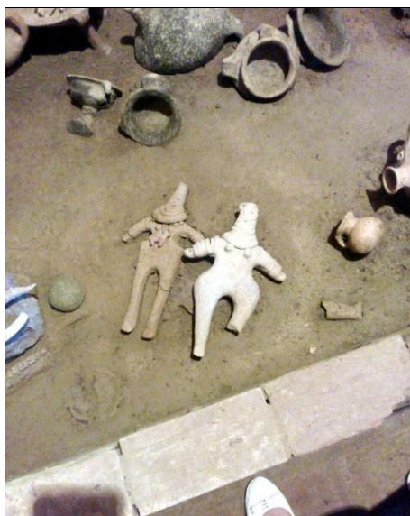
Археологические раскопки. Азербайджанская Республика. Июль 2016 г.