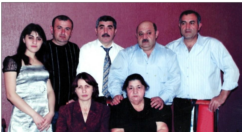
Семья Данакари на торжестве. Город Шахты Ростовская область. 2005 г.