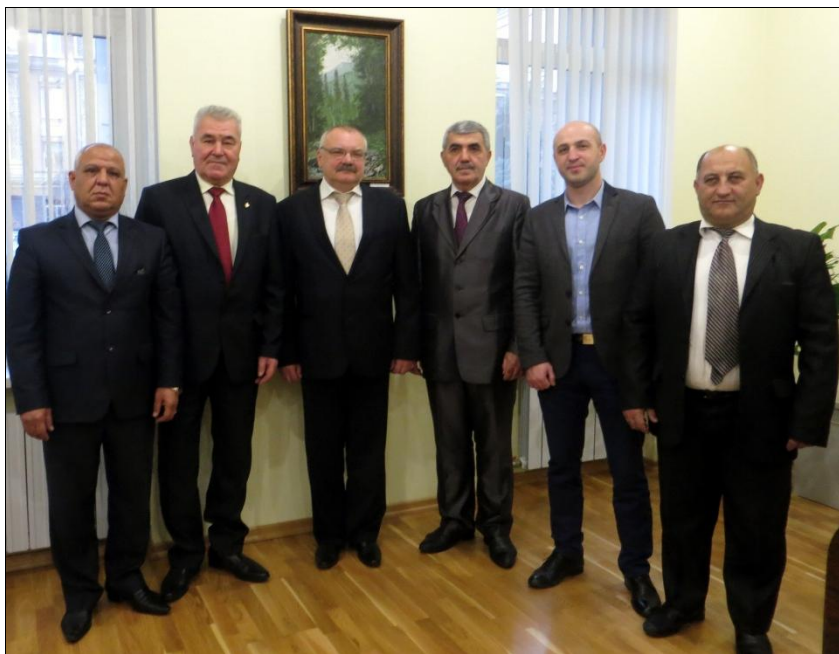
Встреча в Волгоградском институте управления. 2016 г.