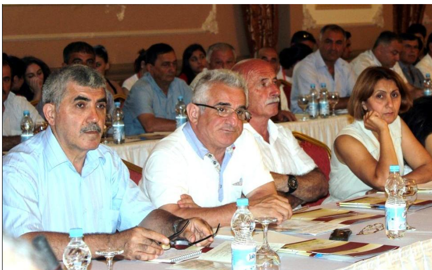
На Пленарном заседании международной конференции по Кавказской Албании. Город Габала (Азербайджан). 20 июля 2016 г.