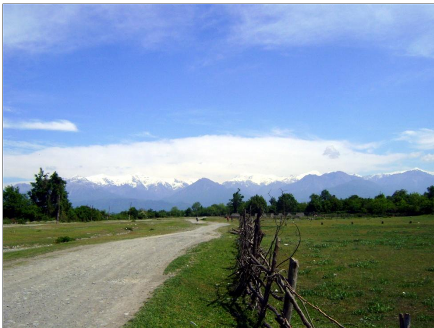
Вид на горы Большого Кавказа с поселка Нидж