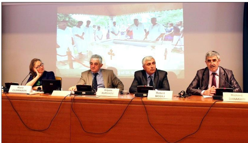
Международная конференция в Италии. Рим. Апрель 2015 г.