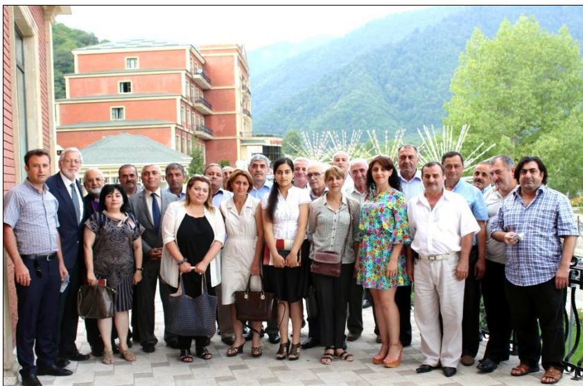
Участники международной конференции. Город Габала (Азербайджан). 20 июля 2016 г.