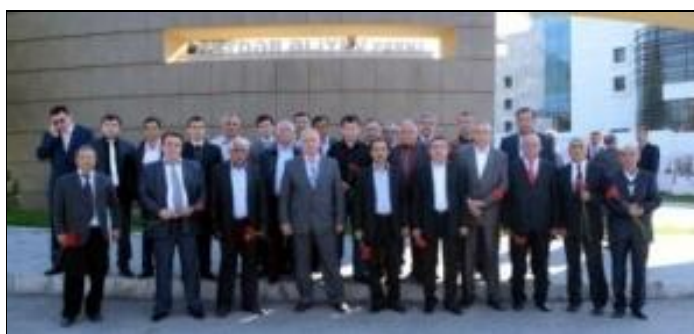
Делегаты Международной научной конференции. Город Габала (Азербайджан). Апрель 2012 г.