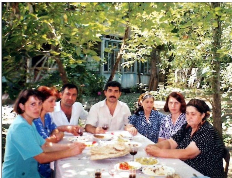
Родной дом и двор. Семья Данакари с гостями. Село Нидж. 1999 г.