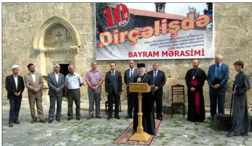
Выступление Архиепископа Бакинского и Прикаспийского, отца Александра на мероприятии 1700-летия принятия христианства удинами. 2013 г.