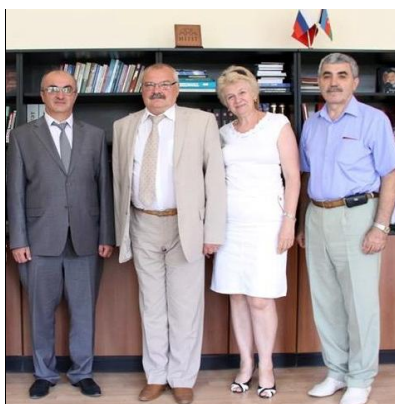
Встреча в Баку. Славянский университет. Июль 2015 г.