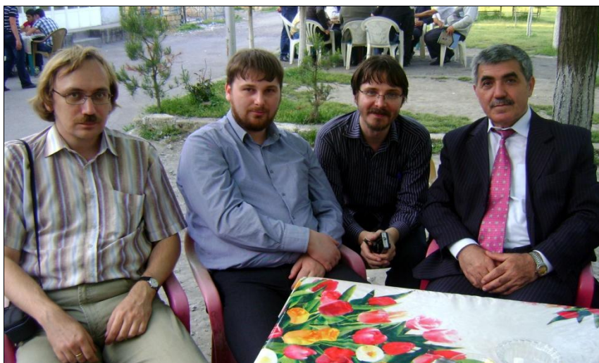
Ученые-лингвисты из Москвы. Во время работы Международной научной конференции. Апрель 2012 г.