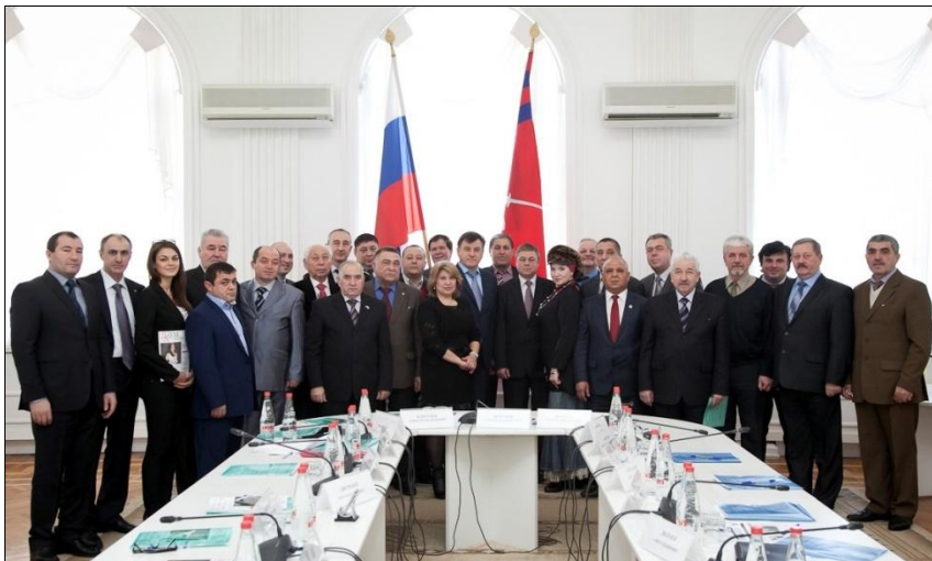
Встреча руководителей национальных общин в Администрации Волгоградской области. 2013 г.