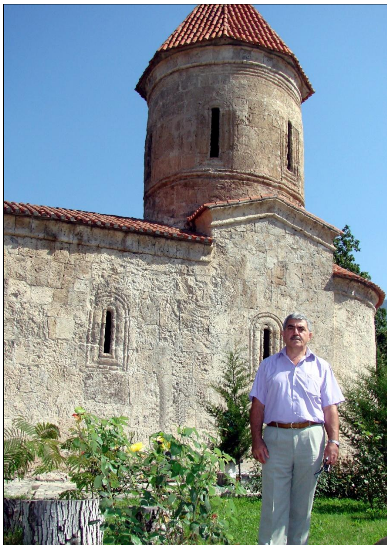
Албано-удинский христианский храм, построенный апостолом св. Елисеем (I–III вв. до н. э.). Село Киш. Шекинский район. Азербайджан