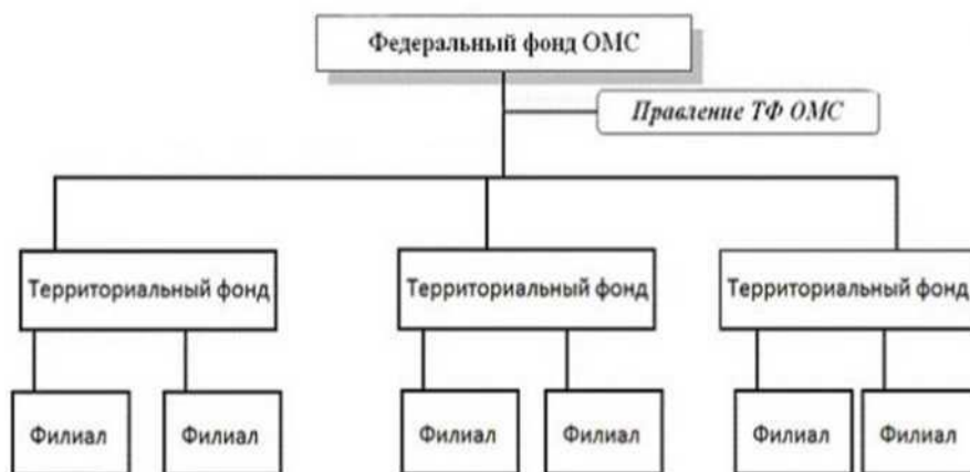
Рисунок 3 – Структура фонда ОМС 48

Каждое подразделение имеет свои функции и полномочия на предоставление гражданам медицинского обслуживания и контроля соблюдения законодательства, вместе подразделения составляют единую систему. Финансирование системы обязательного медицинского страхования для деятельности здравоохранительных учреждений возможно посредством страховых компаний и фондов; подобные структуры обязаны получить лицензию на этот род деятельности.