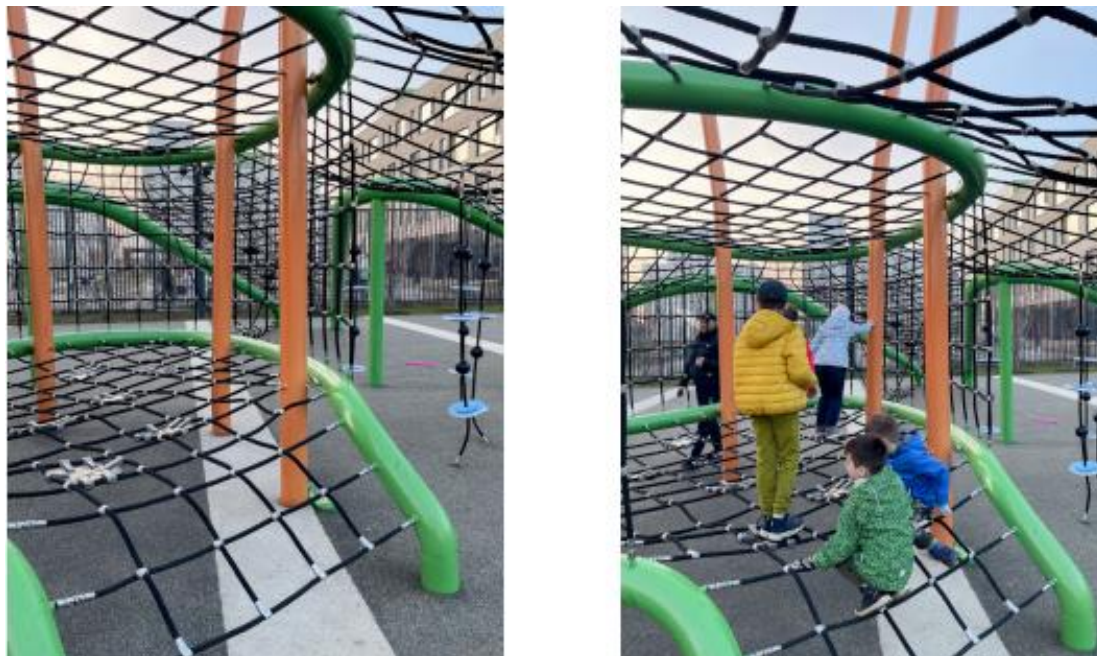
Рис. 13. Примеры визуализации проекта

Люди – существа социальные. Поэтому нам нравится рассматривать людей на фотографиях. Старайтесь показывать в ваших кадрах людей, как они используют ваш проект, какие эмоции они испытывают. Абсолютно пустой кадр, особенно для конкурсной фотографии, не будет иметь должного внимания.