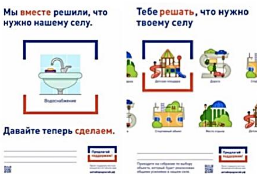
Рис. 6. Визуализация информационных листовок

Логотип, как булавка, которая собирает все информационные потоки, заметна во всех средах и на разных носителях. В данном случае само решение – сине-красное, а красно-синяя рамка позволяет свободнее оперировать таким логотипом. Например, публикуя информационные сообщения в газетах можно облекать их в такую рамку, тем самым отсылать к логотипу. Когда разрабатываются подобные визуальные решения, следует обращать внимание, что они должны быть более динамичными, то есть элементы логотипа должны эффективно работать в разных средах.