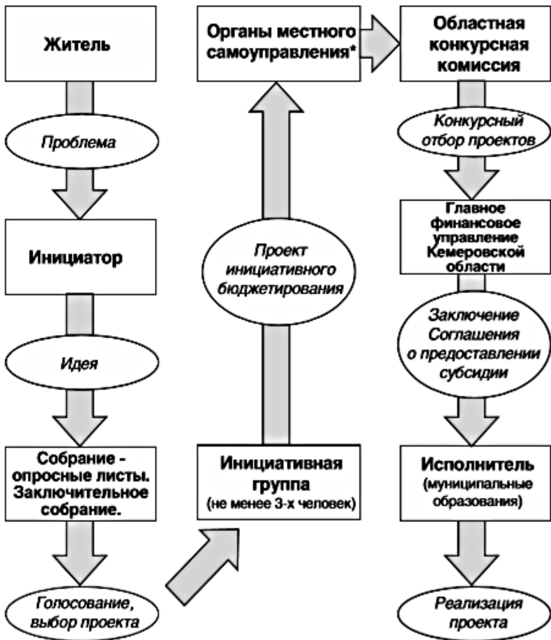
Рис. 1. Последовательность взаимодействия участников инициативного бюджетирования