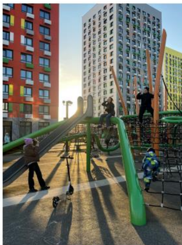
Однако кадры, сделанные в "золотое" время, могут дать глубину и динамику, благодаря игре теней