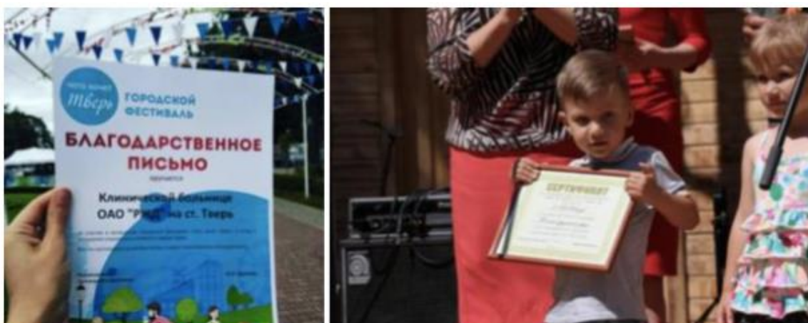
Рис. 8. Примеры «публичной благодарности»

Пока еще мало развит инструмент «публичной благодарности» спонсорам, юридическим лицам, которые вносят деньги. У этого инструмента также есть определенный информационный и публичный потенциал. Мероприятия, когда победителей публично оглашают, вручают сертификат, или отмечают глав муниципалитетов, отличившихся в реализации таких программ. Пока таких примеров встречается немного, но это также очень интересный информационный повод для журналистов.