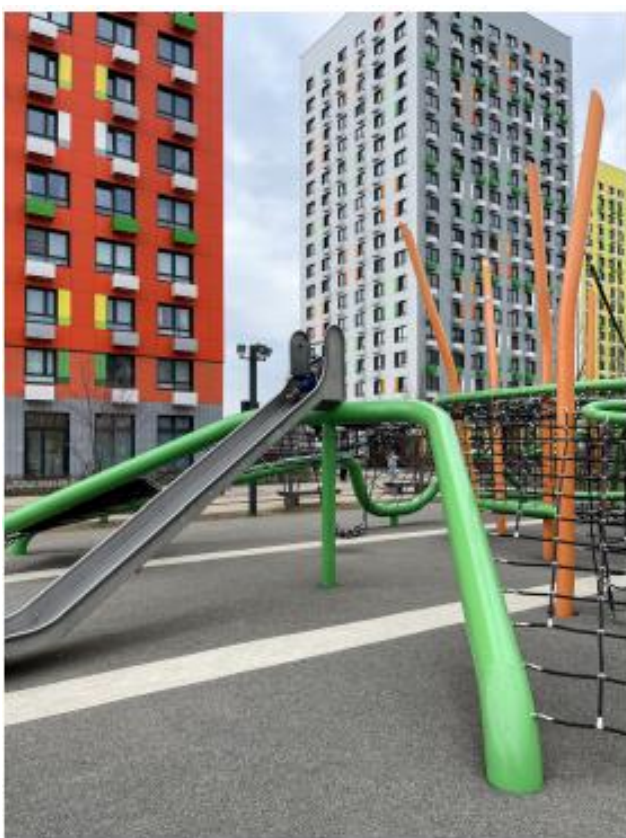
Снимать в облачную погоду можно абсолютно в любое время суток

Для того чтобы получить хороший кадр, важно учитывать время для съемок. Кадры, сделанные в середине дня в солнечную погоду, будут в большинстве случаев пересвечены или испорчены обилием темных участков. Также такие фотографии очень трудно редактировать. Поэтому советуем снимать ваши проекты инициативного бюджетирования в «золотое» время для съемок: ранний рассвет или закат, когда солнце уже всходит и садится.