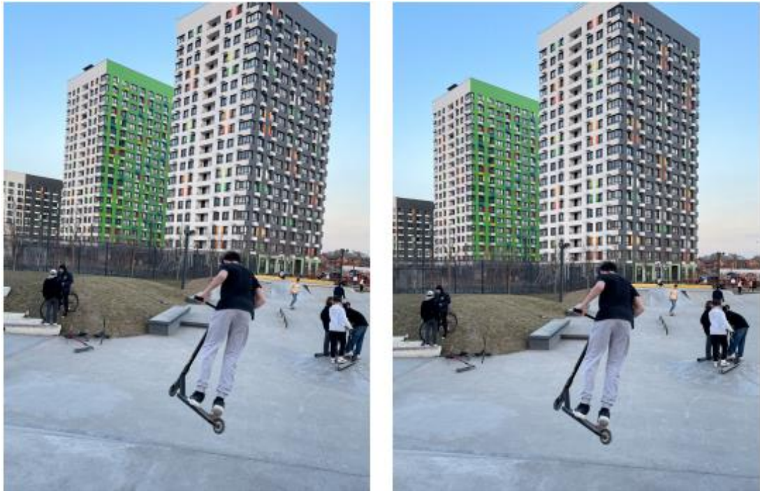
Рис. 11. Примеры визуализации проекта

Создавайте в кадре атмосферу. Не фотографируйте только один элемент вашего реализованного проекта. Подойдите с другой стороны, охватите ближние объекты – кадр будет иметь совсем другую историю.