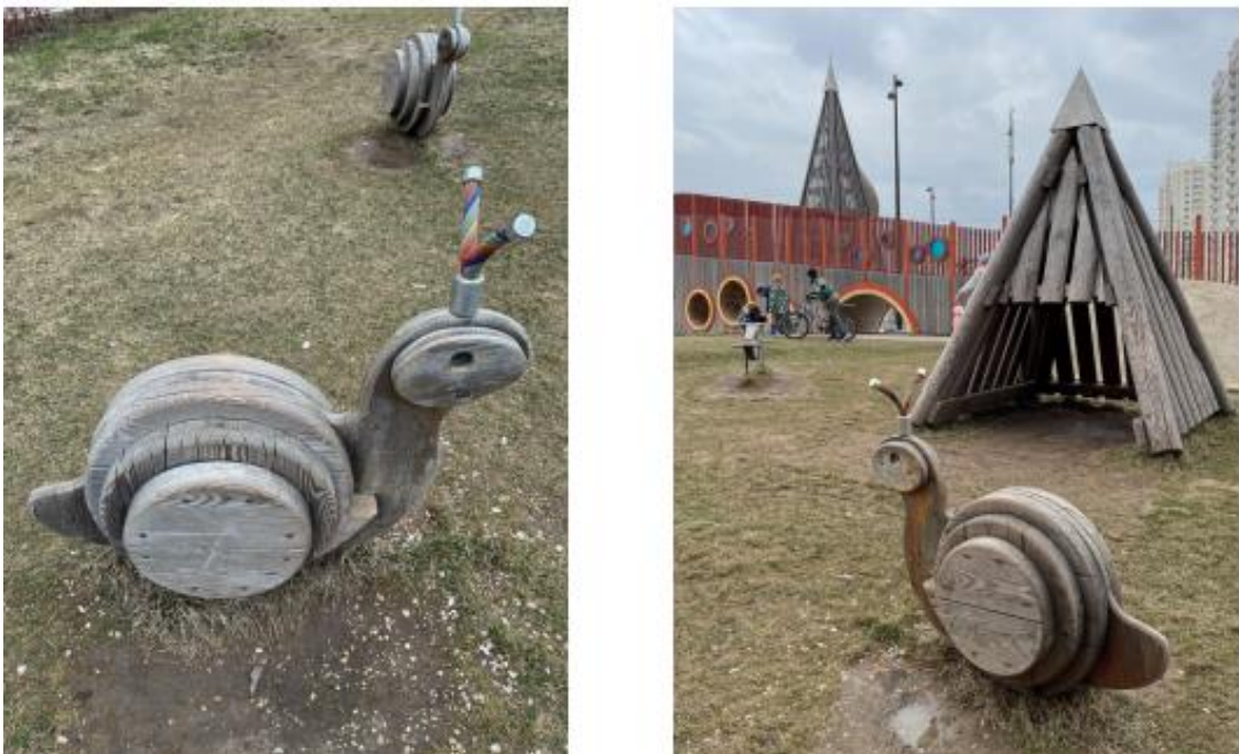
Рис. 12. Примеры визуализации проекта

Создавайте в кадре атмосферу. Не фотографируйте только один элемент вашего реализованного проекта. Подойдите с другой стороны, охватите ближние объекты – кадр будет иметь совсем другую историю.