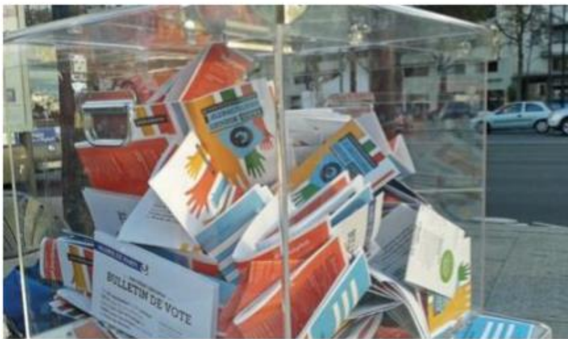
Рис. 7. Реклама программы инициативного бюджетирования

Пока еще мало развит инструмент «публичной благодарности» спонсорам, юридическим лицам, которые вносят деньги. У этого инструмента также есть определенный информационный и публичный потенциал. Мероприятия, когда победителей публично оглашают, вручают сертификат, или отмечают глав муниципалитетов, отличившихся в реализации таких программ. Пока таких примеров встречается немного, но это также очень интересный информационный повод для журналистов.